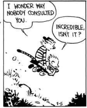
(Bill Waterson "Calvin and Hobbes: The Revenge of the Baby-Sat")